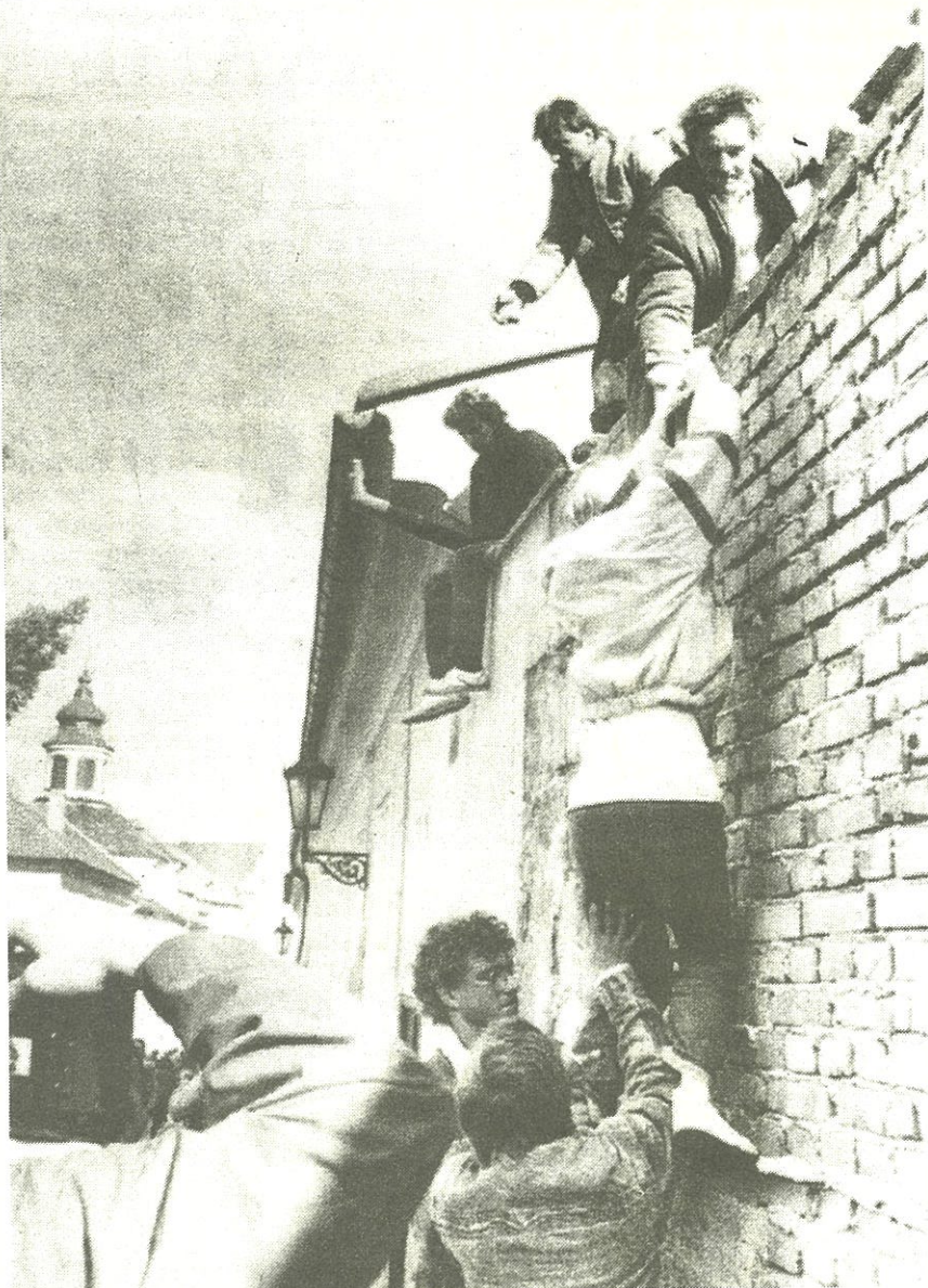
DDR burgers zoeken toevlucht in Westduitse ambassade in Praag (3 okt. '89).

actief, waaronder ook een 'Liberaal-democratische partij'. Maar welke zin heeft het bestaan van zo'n liberale partij in een staat die grondwettelijk vastgelegd is op de uitsluiting van private eigendom in de produktiemiddelen? Zou een systeem van 'democratisch socialisme' die bepaling uit zijn grondwet moeten schrappen en de mogelijkheid